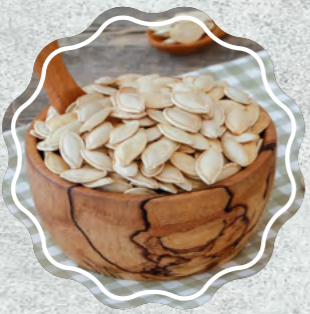
Kabak Çekirdeği Topak Kavrulmuş