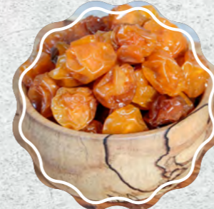
Erik Kuru Çekirdekli Sarı