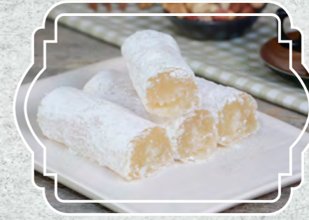
Şeker Sucuğu Sade