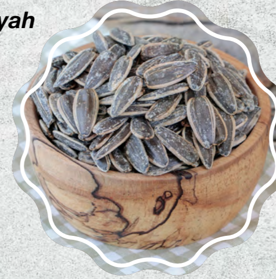
Ay Çekirdeği Siyah Tuzlu