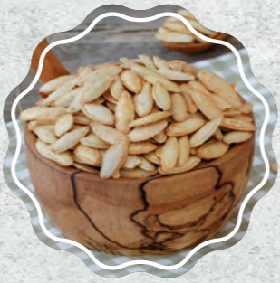
Kabak Çekirdeği Sivri Tuzlu