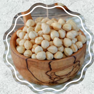
Fındık İçi (Girusun)