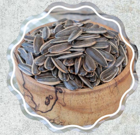
Ay Çekirdeği Siyah Kavrulmuş