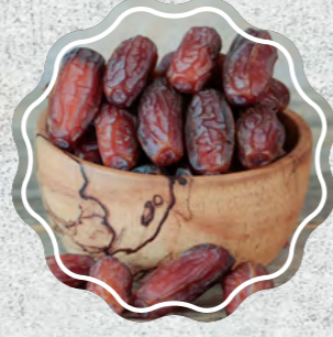
Medine Hurma Duble