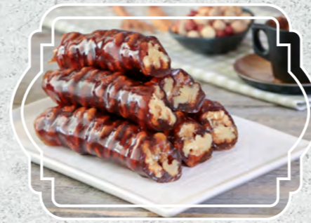
Kedi Bacağı Kelebek

Var olan lezzetleri, tatlıyla birleştiren bu ürünler sağlığın dengesini bozmayacak oranlarda, güvenilir yiyeceklerin makinelerde işlenmesi ile üretiliyor.