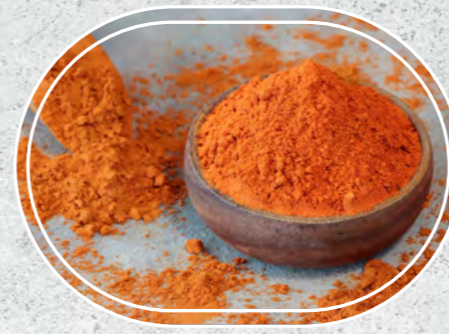
Toz Biber Tatlı

Efsane diyarlardan toplanan bu ürünler tatları değişmeden, verecekleri lezzet bozulmadan, modern tesislerde buram buram kokularıyla birlikte üretiliyor.