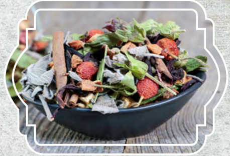
Kış Çayı Karışık