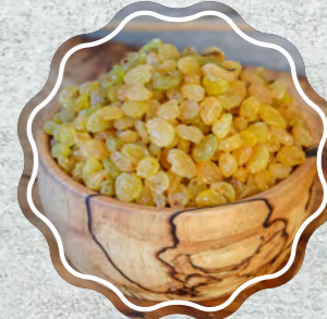
Sarı Üzüm İran