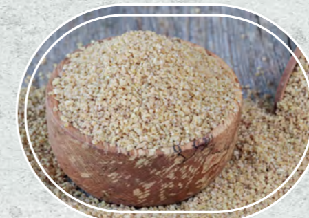
Bulgur Köy Tipi