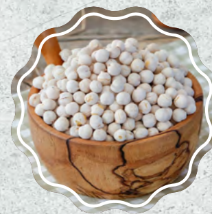
Beyaz Leblebi Tek Kavruk