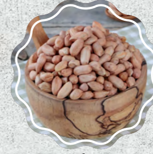
Fıstık İçi Ufak Çiğ | Kavrulmuş