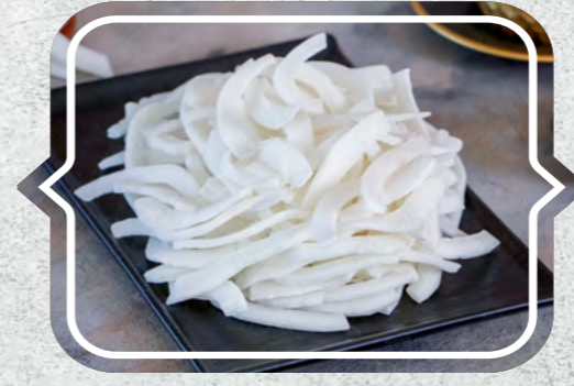
Hindistan Cevizi Kuruşu