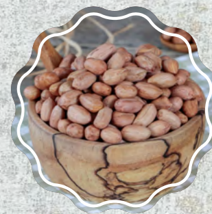
Fıstık İçi Çiğ