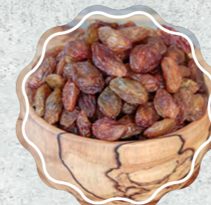
Besni Üzümlü Sarı