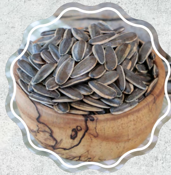
Ay Çekirdeği Siyah Çiğ

Eleme makinelerinden geçen en iyi taneler kabuklu ya da kabuksuz, lezzeti koruyan makinelerde kavrularak, tuz ya da diğer tatlarla keyifli hale getiriliyor.