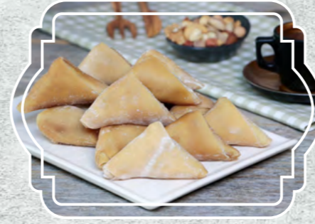
Antep Fıstıklı Muska