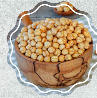
Sarı Leblebi Çiğ