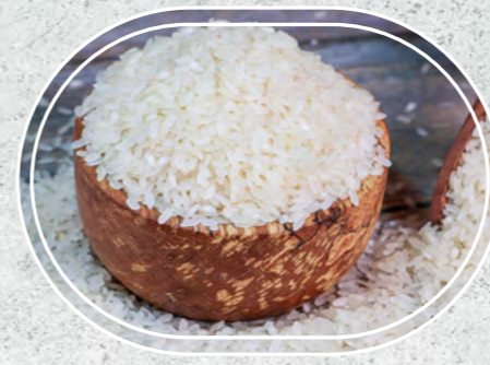
Pirinç Baldo | Osmancık

Toprağın güvenilir bir şekilde sunduğu taneleri, tencerele taşıyan bu ürünler güvenilir ve sağlıklı tesislerde damak garantili olarak üretiliyor.