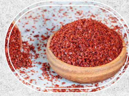
Pul Biber Yaprak