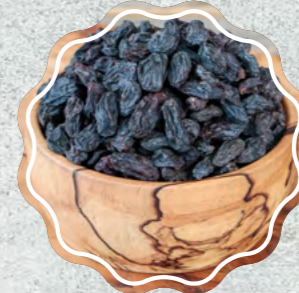
Siyah Üzüm Çekirdeksiz