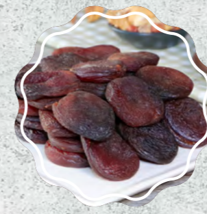
Kayısı Gün Kuru