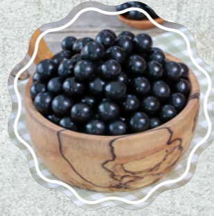
Çikolatalı Leblebi Siyah