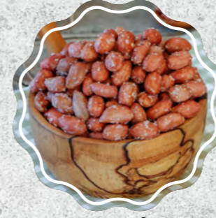
Fıstık İçi Tuzlu