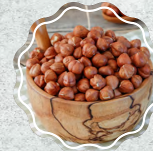
Fındık İçi Çiğ (Giresun)