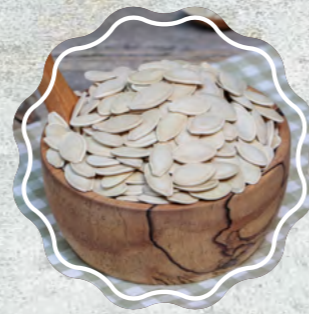
Kabak Çekirdeği Topak Salamura