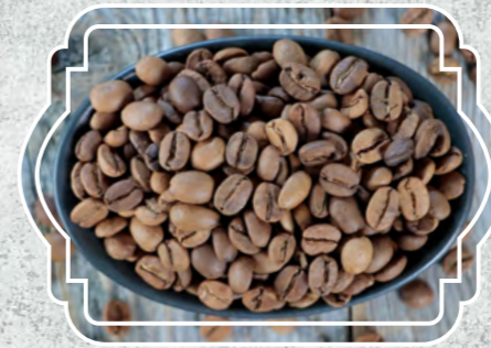
Kahve Çekirdek Orta Kavrulmuş