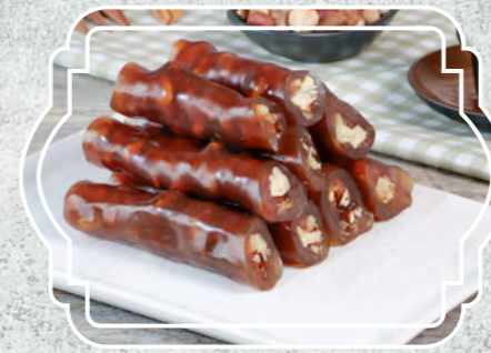
Kedi Bacağı Eko