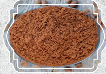
Türk Kahvesi Orta Kavruk