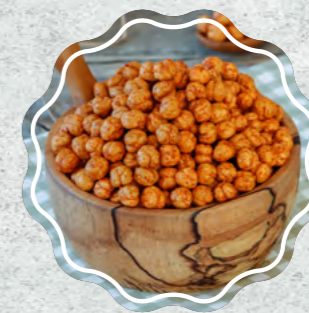
Sarı Leblebi Baharatlı