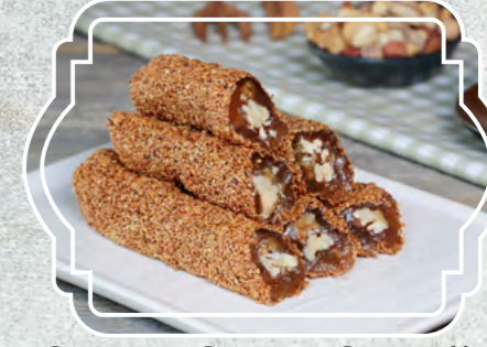
Cevizli Şeker Sucuğu Susamlı