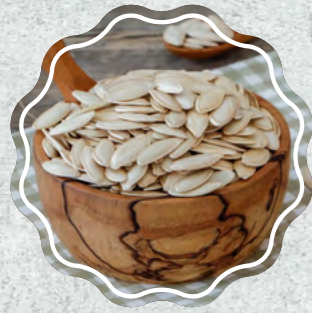
Kabak Çekirdeği Sivri Çiğ