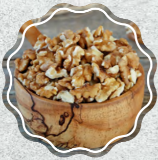
Ceviz İçi Normal