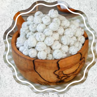
Şeker Leblebi Beyaz