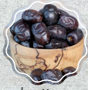
İran Hurma Yaş