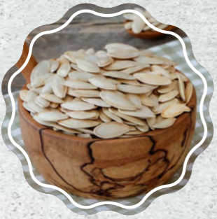
Kabak Çekirdeği Sivri Kavrulmuş