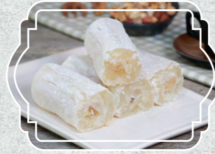
Şeker Sucuğu Cevizli