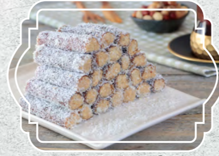
Fındıklı Pestil Sarma Hindistan Cevizli