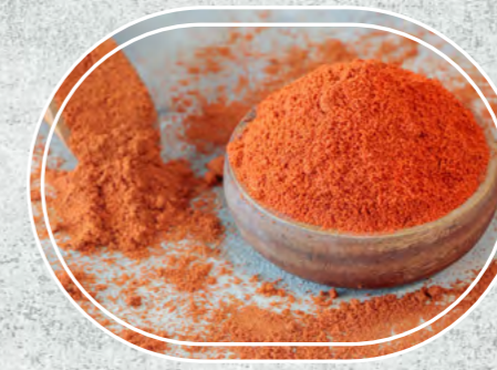
Toz Biber Acı