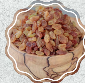
Sarı Üzüm İzmir