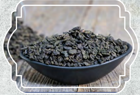
Yeşil Çay Tomurcuk