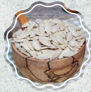
Kabak Çekirdeği Sivri Salamura