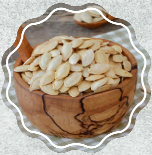
Kabak Çekirdeği Topak Tuzlu