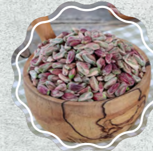
Antep Fıstığı İçi Boz