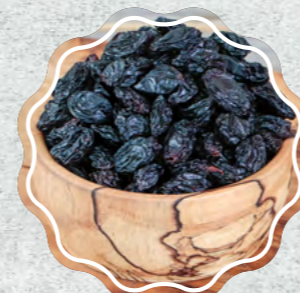
Besni Üzümlü Siyah