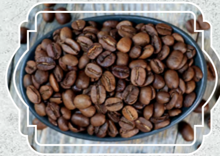
Kahve Çekirdek Çift Kavrulmuş

Sertlikleri, verdikleri keyif ve tazelikleri ölçülebilir kahve ve çaylar tarladaki tatlarından taviz verilmeden, kalitesi bozulmadan, sohbetlere yetiştiriliyor.