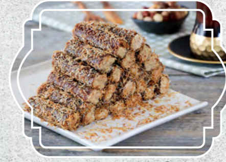
Fındıklı Pestil Sarma Kadayıflı