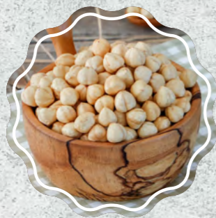
Fındık İçi (Ordu)