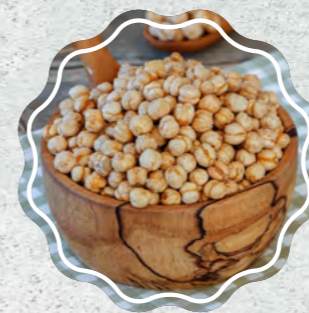
Sarı Leblebi Tuzlu