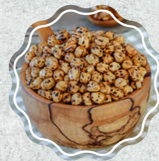
Sarı Leblebi Hint