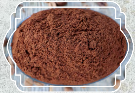
Türk Kahvesi Çift Kavrulmuş