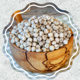
Beyaz Leblebi Çift Kavruk