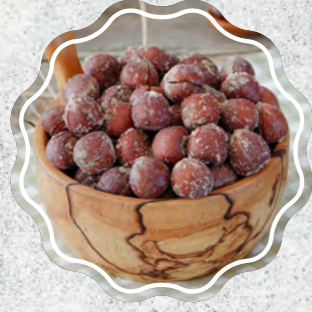
Kabuklu Fındık Tuzlu