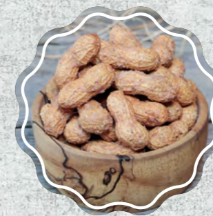
Kabuklu Fıstık Tuzlu