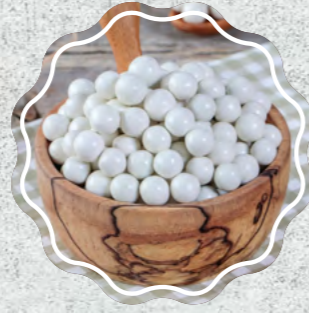
Çikolatalı Leblebi Beyaz