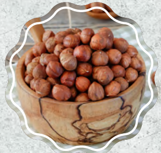
Fındık İçi Çiğ (Ordu)