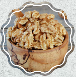
Ceviz İçi Kelebek