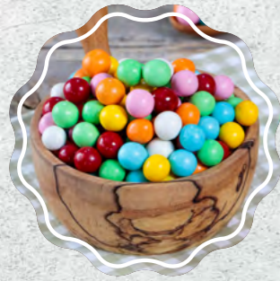
Çikolatalı Leblebi Renkli