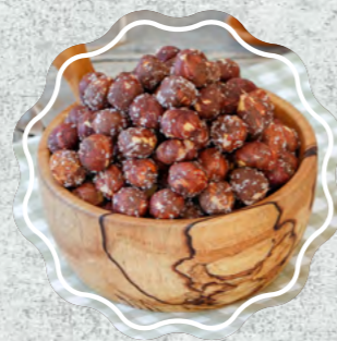
Fındık İçi Tuzlu