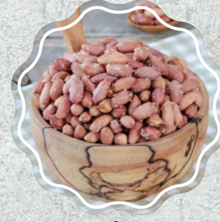
Fıstık İçi Ufak Tuzlu