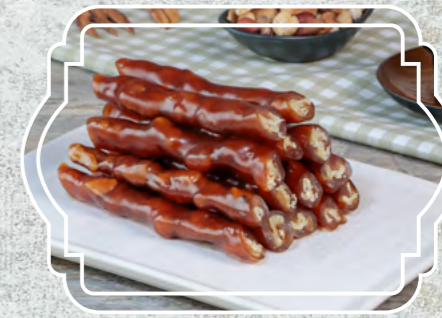
Kedi Bacağı İnce