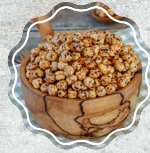
Sarı Leblebi Kavrulmuş