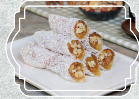
Cevizli Şeker Sucuğu Hindistan Cevizli