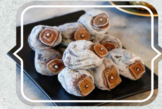
Trabzon Hurması Kuruşu (Cennet Hurması)