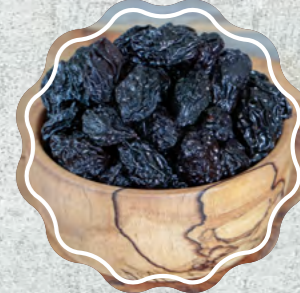
Erik Kuru Çekirdekli Siyah