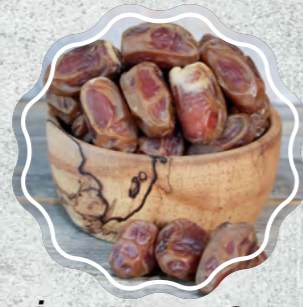
İran Hurma Sarı