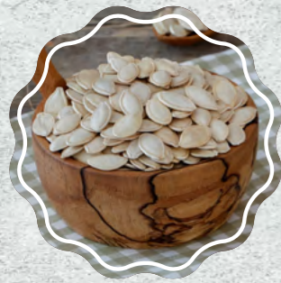
Kabak Çekirdeği Topak Çiğ