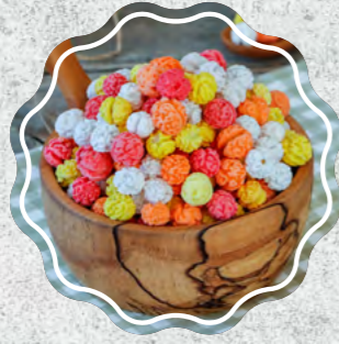
Şeker Leblebi Renkli