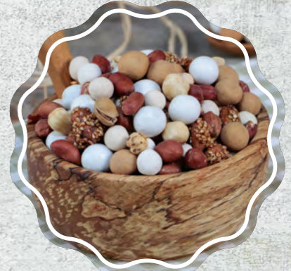
Normal Çikolepli Karışık