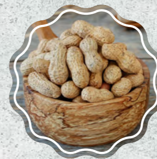
Kabuklu Fıstık Kavrulmuş