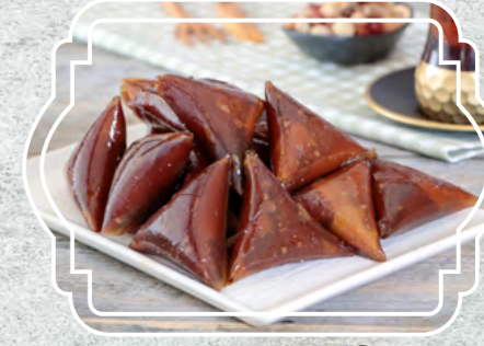
Fındıklı Pestil Sarma Muska