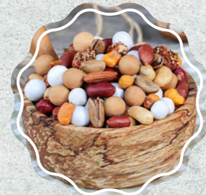
İyi Çikolepli Karışık