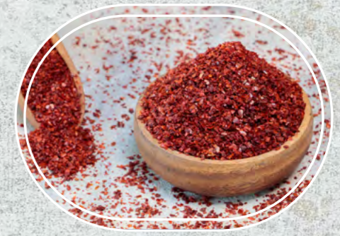
Pul Biber İpek