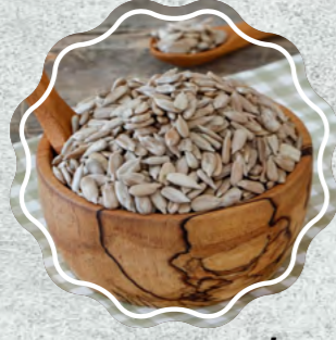
Ayçekirdeği İçi Çiğ | Kavrulmuş | Tuzlu