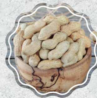
Kabuklu Fıstık Çiğ