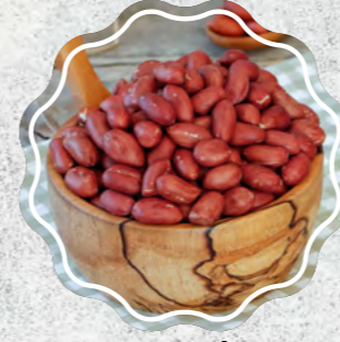
Fıstık İçi Kavrulmuş