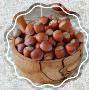
Kabuklu Fındık (Çiğ)